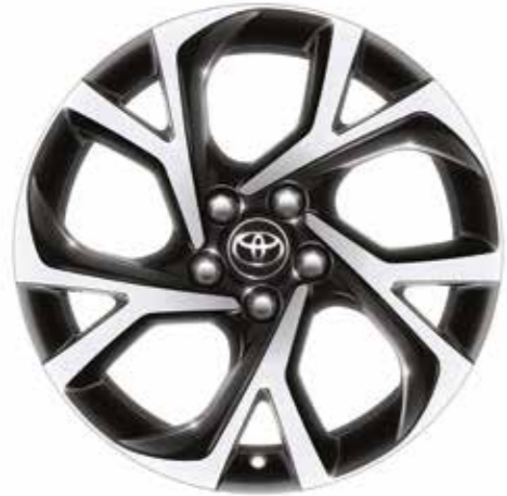
18" Siyah işlenmiş yüzeyli alüminyum alaşımli jantlar (5 kollu) Dynamic versiyonunda standart