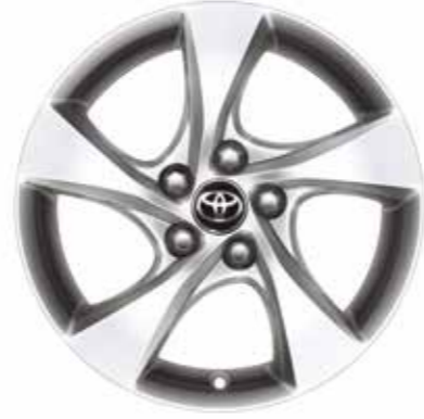
17" Alüminyum alaşımli jantlar (5 kollu) Advance versiyonunda standart