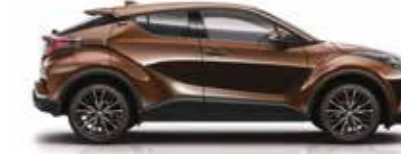
4U3 Günbatımı Bronz (1)