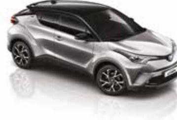
2NK Elmas Gümüş Gri / Siyah Tavan