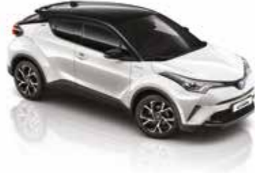
2NA İnci Beyaz / Siyah Tavan