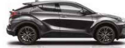
1G3 Metalik Gri (1)