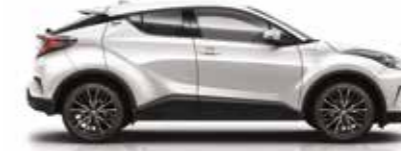
070 İnci Beyaz (2)