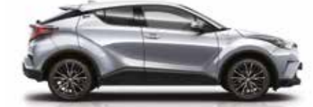
1F7 Gümüş Metalik Gri (1)