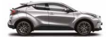
1K0 Elmas Gümüş Gri (1)

*Yalnız Dynamic versiyonumuzda sunulmaktadır