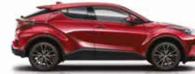
3T3 Kırmızı Mika Metalik (2) / (3)