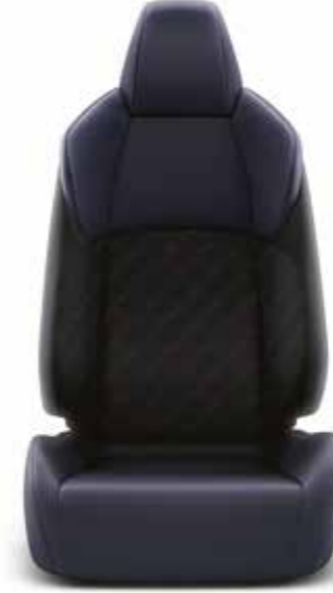
Mavi Siyah Döşeme Dynamic versiyonunda standart