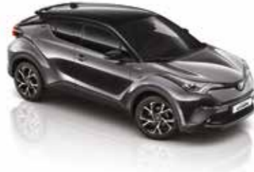
2NB Metalik Gri / Siyah Tavan