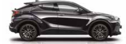
209 Siyah (1)