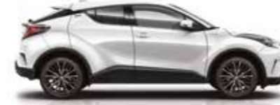
040 Kar Beyaz (3)