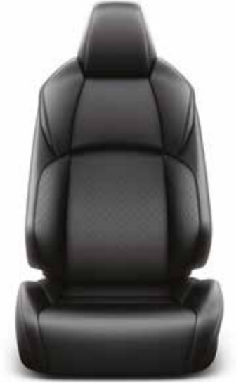
Siyah Deri Döşeme Dynamic ve Diamond versiyonlarında opsiyonel olarak sunulmaktadır.