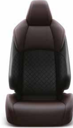
Koyu Kahverengi Yarı Deri Döşeme Diamond versiyonunda standart