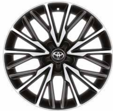
18" Siyah işlenmiş yüzeyli alüminyum alaşımli jantlar (10 kollu) Diamond versiyonunda standart