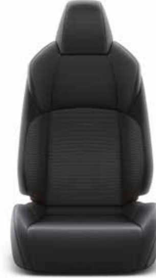
Siyah Döşeme Advance versiyonunda standart