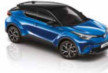
2NH Şimşek Mavi / Siyah Tavan