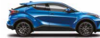
8X2 Şimşek Mavi (1) / (3)