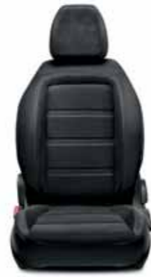
LOUNGE Siyah & Bej-Spor Dikişli File Tasarım Örgü Kumaş ve Kadife Dokulu Detaylar