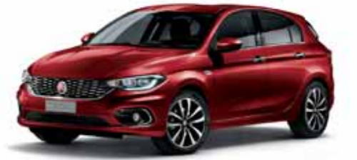
716 ALEV KIRMIZISI METALİK