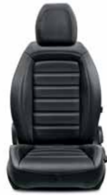
OPSİYONEL Siyah-Sentetik Deri