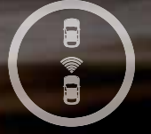
OTOMATİK ACİL DURUM FRENİ

Söz konusu güvenlik olduğunda, Egea Hatchback size hayallerinizin ötesini sunuyor. Standart 6 hava yastığı, Yokuş Kalkış Destek Sistemi ve Acil Fren Destek Sistemi gibi özellikleri de içeren son nesil ESC. Tüm bunların yanında Egea Hatchback, 200 km/s hıza kadar kaza riskini tespit ederek sizi uyararak ve gerekirse otomatik fren yapabilen aktif güvenlik sistemlerini ve yalnızca hızı değil, önünüzdeki araçla takip mesafesini de koruyan Adaptif Hız Sabitleme Sistemi'ni sınıfında ilk kez standart donanımlar arasında sunuyor.