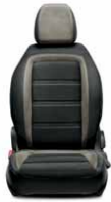
LOUNGE Siyah-Spor Dikişli File Tasarım Örgü Kumaş ve Kadife Dokulu Detaylar