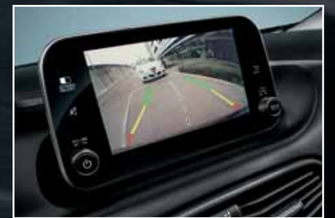
GERİ GÖRÜŞ KAMERASI