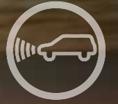
ADAPTİF HIZ SABİTLEME SİSTEMİ