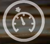
HIZ SABİTLEME SİSTEMİ