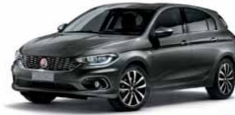
695 KURŞUN GRİ METALİK