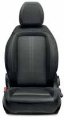
EASY Siyah-Spor Dikişli Fitilli Örgü Kumaş