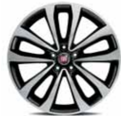
17" Elmas Kesim Alaşımlı Jant