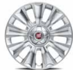
16" Kapak Jant