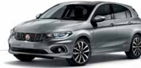
612 MİSTİK GRİ METALİK