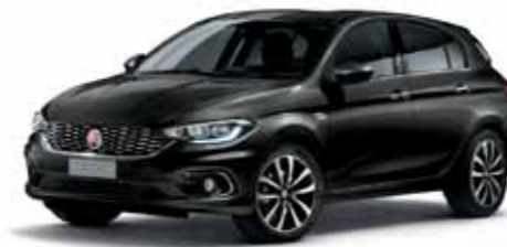
718 ROCK SİYAHİ METALİK