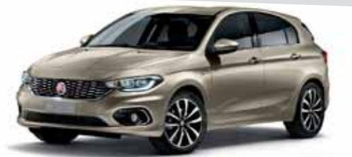
722 İNCİ BEJİ METALİK