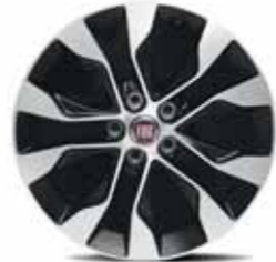
16" Elmas Kesim Alaşımlı Jant