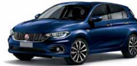
717 AKDENİZ MAVİSİ METALİK