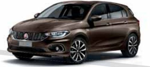
444 BRONZ KAHVE METALİK