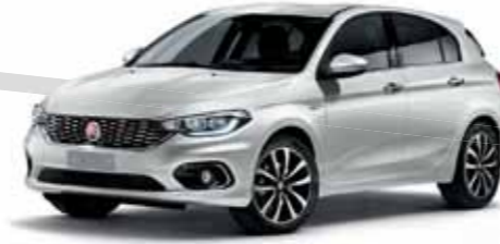
249 BULUT BEYAZI PASTEL