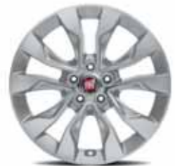
16" Alaşımlı Jant